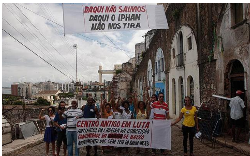
Figura 4 – Protesto dos artífices nos festejos de Nossa Senhora da Conceição da Praia

No dia 8 de dezembro, data destinada às comemorações da Nossa Senhora da Conceição, em Salvador, a comunidade organizou um protesto contra o Iphan-BA, questionando os termos e os objetivos sustentados pelo órgão federal com a finalidade de expulsá-los do território. Essas, entre outras ações, deram visibilidade ao conflito da comunidade pela luta para permanecer no Centro Histórico de Salvador (MARTINS, 2014).