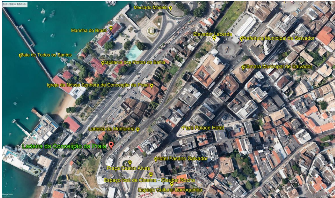
Figura 1 – Centro Histórico de Salvador