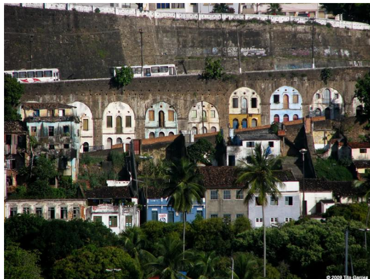
Figura 3 – Arcos da Ladeira da Montanha fotografados da Baía de Todos os Santos.

Mesmo com esse misto de insegurança e de ansiedade, segui pelas ruas e ladeiras do centro histórico. Destaquei, em linhas anteriores, que essa região não é totalmente estranha. Fui morador de localidades adjacentes em ocasiões diferentes da minha vida. Por isso, sei que o fato de ser negro e de ter dreadlocks facilitava a minha circulação por ali. Não sou interpelado por olhares interrogadores, nem me sinto um estranho. Essas impressões afinam-se com as afirmações que já haviam sido apontadas nos materiais de análise, quando pesquisava a zona central soteropolitana. O patrimônio histórico, como já foi destacado anteriormente, passou por um processo de esvaziamento, sendo, gradativamente, reocupado por uma população majoritariamente negra e pobre. Apesar das políticas de revitalização ocorridas em décadas passadas, os espaços que não foram contemplados com essas intervenções conservavam essa dinâmica socioespacial. Na Ladeira da Conceição da Praia, reside e/ou trabalha uma população de afro-baianos de baixa renda.