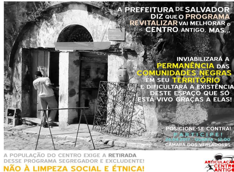
Figura 5 – Cartaz produzido pela Articulação Centro Antigo.